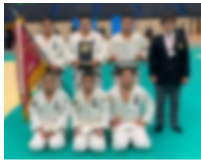
男子団体メンバー

12月20日(日)に福岡県中学校新人体育大会柔道大会が行われ、本校男女柔道部が出場し、男子は優勝、女子も3位という快挙を成し遂げました。男女とも高い目標を持ち、継続して厳しい練習や自己努力を行った結果だと思います。本当によく頑張りました。おめでとうございます！！