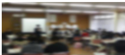
【生徒会役員による説明】

2月2日（月）に、新1年生の入学説明会を実施しました。生徒会役員による中学校生活についての説明や部活動生による部活動の紹介、そして授業見学を行いました。