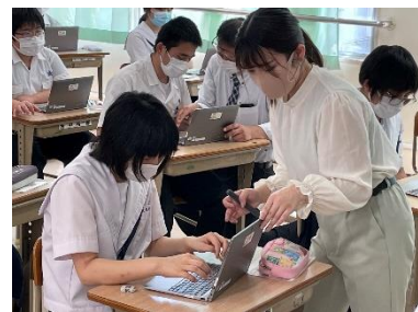
【「みんな理解が早いね」】