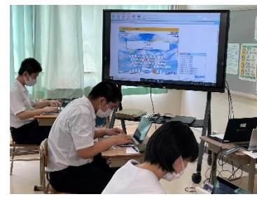
【電子黒板との連動】