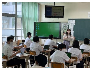
【武田先生による導入授業】