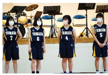
【女子バスケット部】