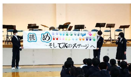
【生徒会執行部の説明】

4月14日（水）に新入生歓迎集会を行いました。生徒会執行部より本年度のスローガンや生徒会活動について説明がありました。また部活動紹介では、各部活動の上級生が趣向を凝らしたパフォーマンスで入部の勧誘を行いました。【写真：一部紹介】